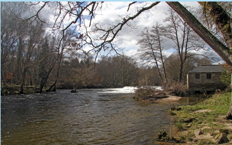
Caneiro e muíño no Río Parga.