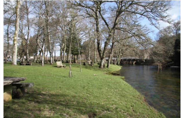
Río Parga, ponte e área recreativa da Carballeira