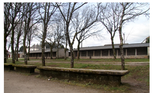
Campo da Feira da Pobra de Parga