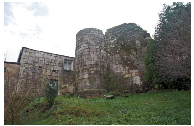
Castelo da Pobra de Parga