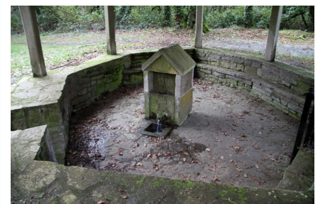
Fonte de Valdovín