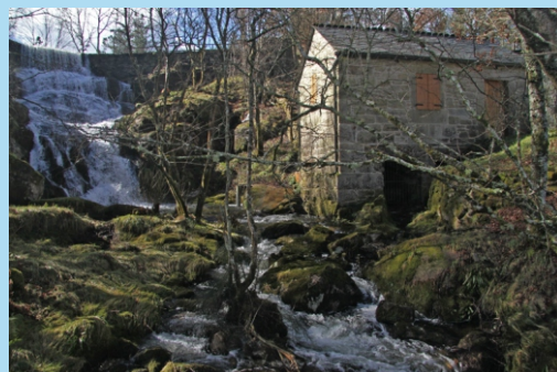
Ferverza da Ruxida e muíño.

Nas proximidades da Pobra de Parga, Santo Estevo, atópase esta fermosa ferverza que forma o rego da Ruxida ao caer por unha fractura nas rochas graníticas desde uns 10 m de altura (no verán ten moi pouco caudal). A zona está acondicionada como área de lecer e é un bo lugar para pasar unhas horas ou simplemente motivo para unha excursión ou unha camiñada. Uns 500 m antes de chegar á ferverza atópase, á dereita do camiño, unha pedra grande coroadada por unha cruz, a Pena Xiboi, un agocho prehistórico datado entre o 8.000 e o 5.000 a. de C., declarada B.I.C. (Ben de Interese Cultural) pola Xunta de Galicia.